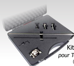
Kit compas pour Torche TPT 40 040205