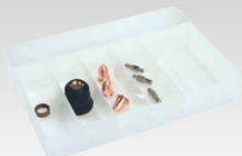
Coffret consommables pour Torche TPT 40 45 A - 039957