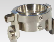
Chariot pour Torche TPT 40 040199