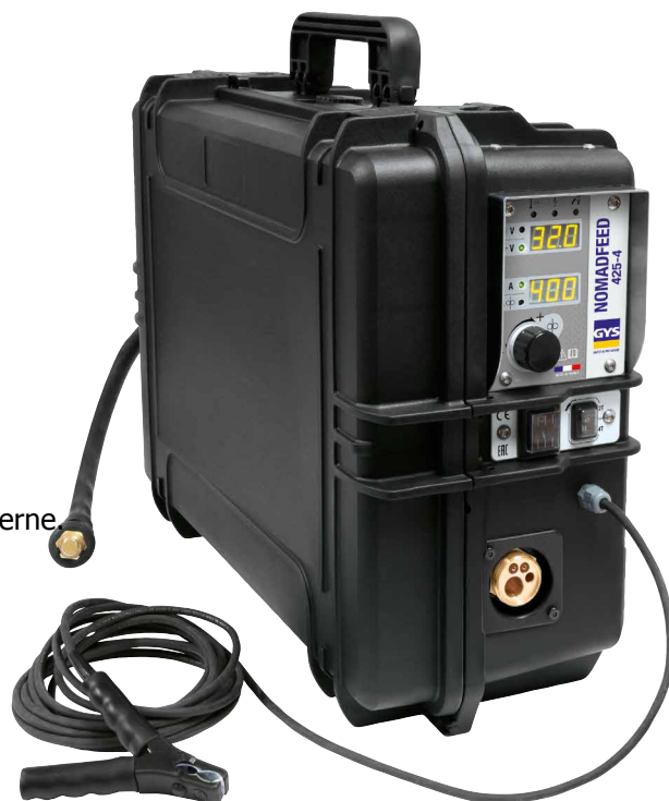
Livré sans accessoires