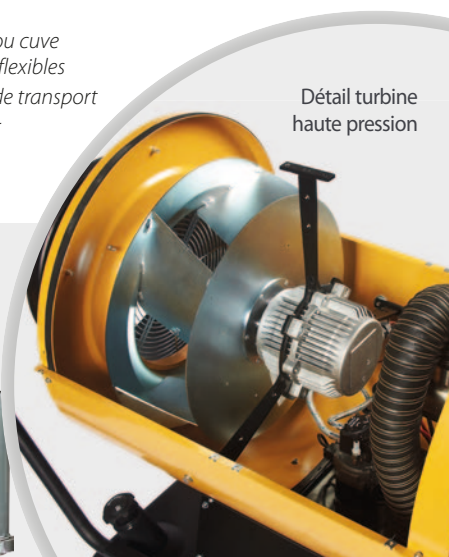
Détail turbine haute pression