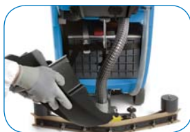
Compartiment des batteries.

En option : brosse de 550mm et suceur de 780mm. chargeur de batterie intégré