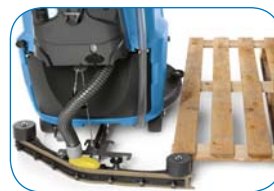
Déverrouillage automatique : le suceur se déclipse automatiquement en cas de choc.