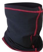
Cache-cou Ref. SIRAC