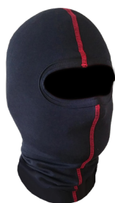
Cagoule Ref. SAGA