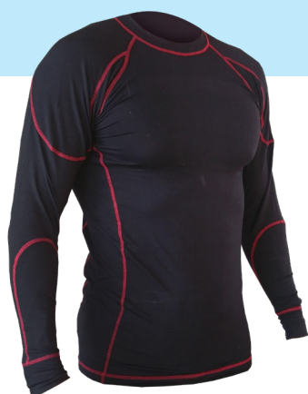
T-shirt manches longues Ref. SAHO