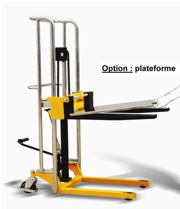
Option : plateforme