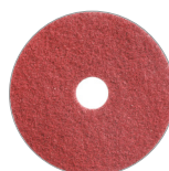
Différents types de pads