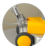
Articulation du manche