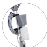
Système d'injection électrique