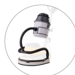
Groupe aspirant (en option)