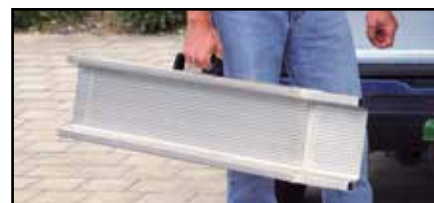
Poignée facilitant la préhension