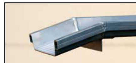
Lèvre d'appui avec butée pour une meilleure stabilité