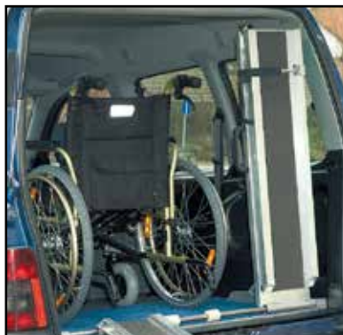
Pendant le transport, les rampes sont maintenues à la verticale sur les côtés grâce aux sandows de blocage.