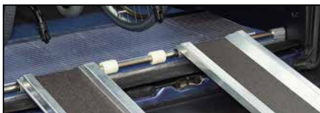
Prévoir un faux plancher de 40 mm. En l'absence de faux plancher il est possible de commander un profilé qui permet de rattraper l'épaisseur.